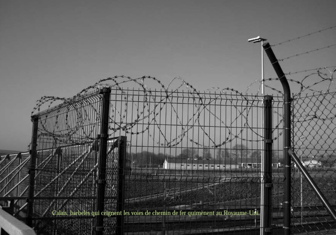
Calais, barbelés qui ceignent les voies de chemin de fer quimènent au Royaume-Uni.