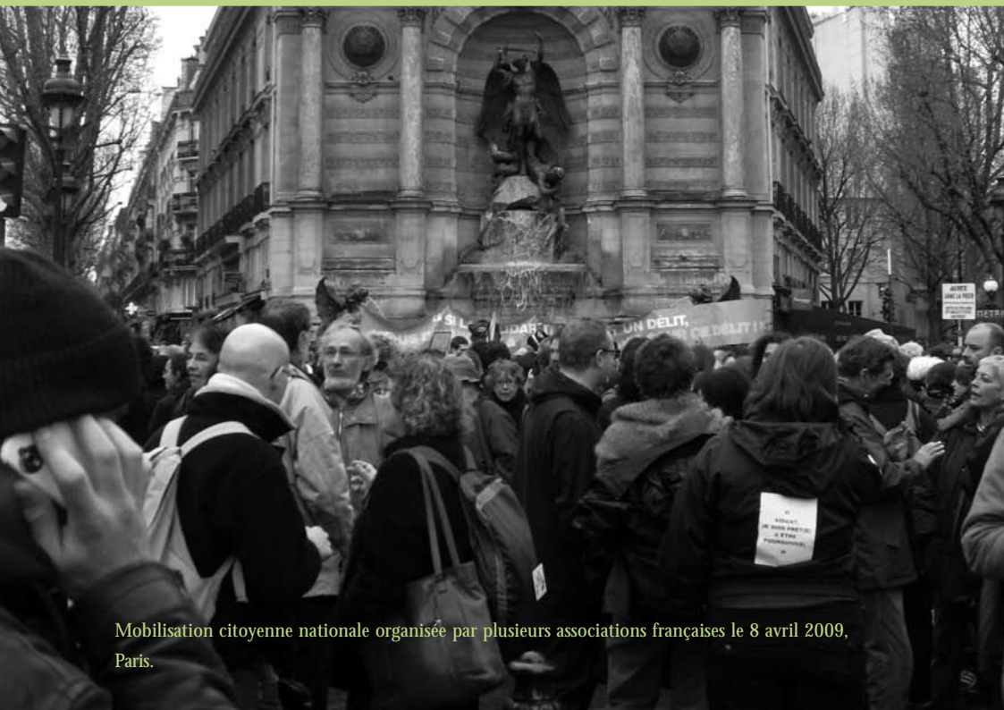
Mobilisation citoyenne nationale organisée par plusieurs associations françaises le 8 avril 2009, Paris.