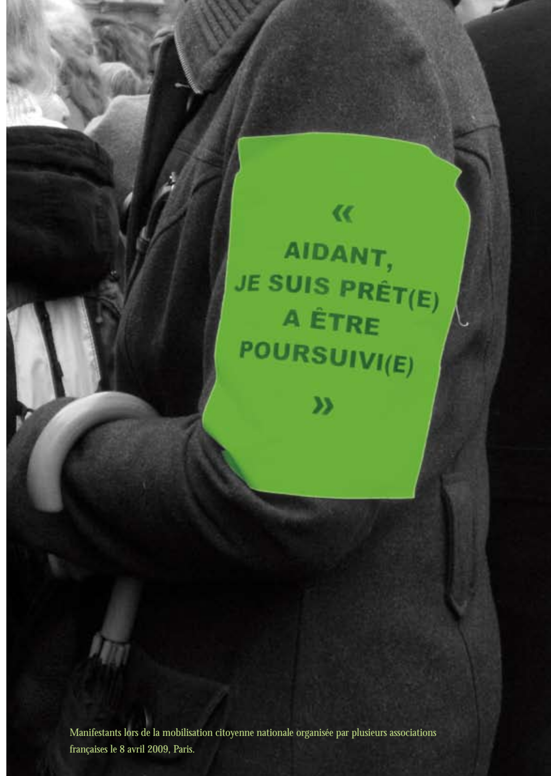
Manifestants lors de la mobilisation citoyenne nationale organisée par plusieurs associations françaises le 8 avril 2009, Paris.