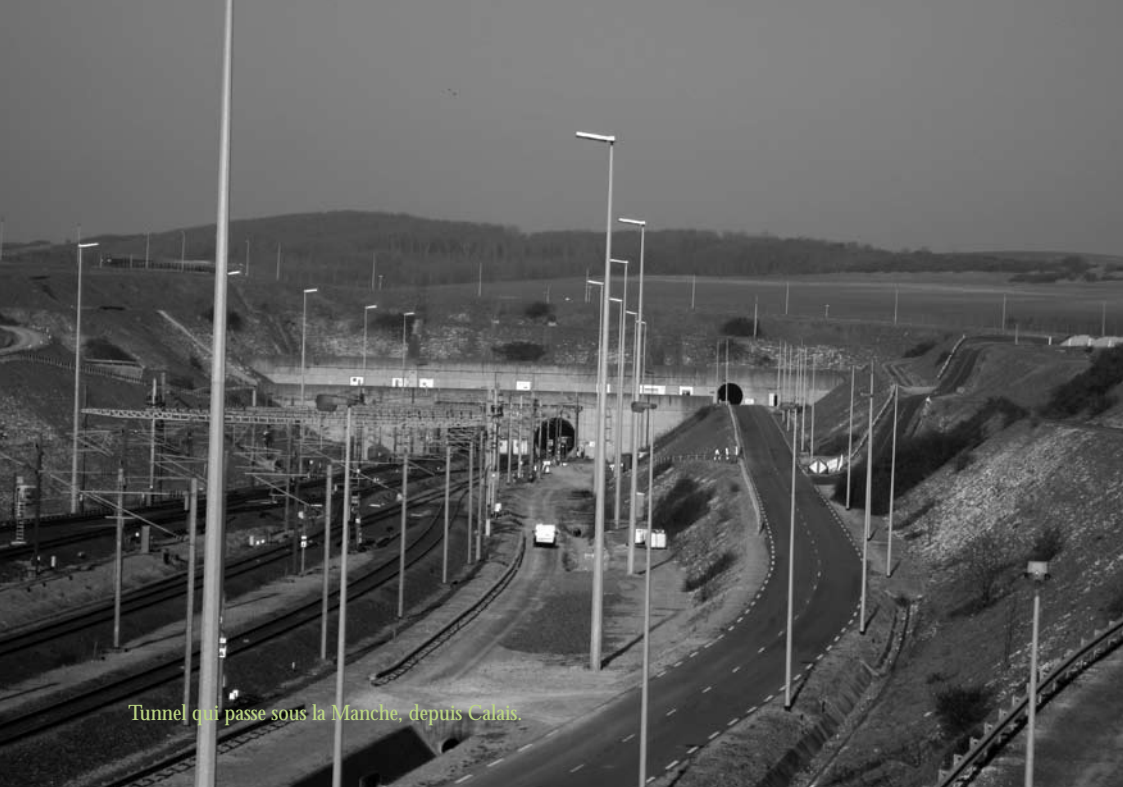
Tunnel qui passe sous la Manche, depuis Calais.