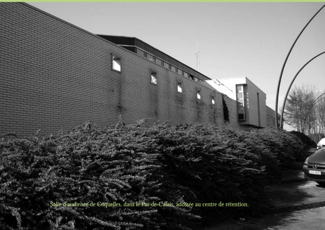
Salle d'audience de Coquelles, dans le Pas-de-Calais, adossée au centre de rétention.